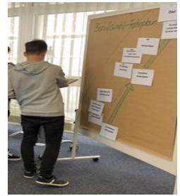
Projektunterricht und Berufsorientierung in Zusammenarbeit mit dem CJD und der Arbeitsagentur