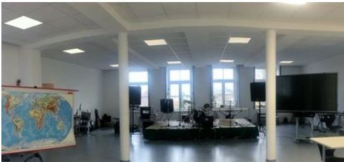
Aula und Musikzimmer

Jede Klasse hat ihr eigenes Klassenzimmer, das sie individuell gestalten kann. Es besteht die Möglichkeit, Unterrichtsmaterialien in der Schule zu lassen.