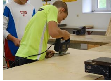
Neigungskurse Kochen und Backen bzw. Handwerk