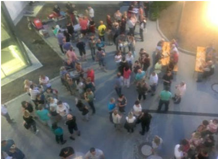
Gemeinsamer Grillabend von Eltern und Lehrern zu Schuljahresbeginn

Elternweihnachtsfeier mit einem bunten Programm aller Schüler für ihre Eltern bzw. gemeinsames Weihnachtslieder-singen im Hof der Schule.