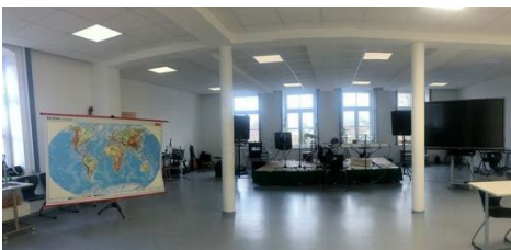
Aula und Musikzimmer

Jede Klasse hat ihr eigenes Klassenzimmer, das sie individuell gestalten kann. Jeder Schüler hat die Möglichkeit, seine Unterrichtsmaterialien in der Schule zu lassen.