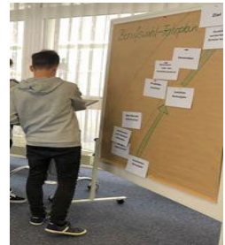
Projektunterricht und Berufsorientierung in Zusammenarbeit mit dem CJD und der Arbeitsagentur